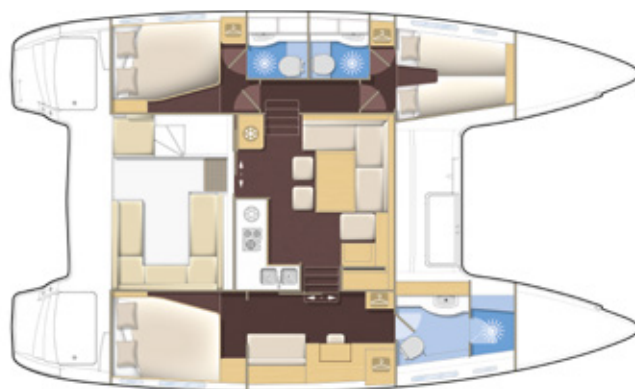
Version propriétaire, 3 salles d'eau Owner's version, 3 bathrooms