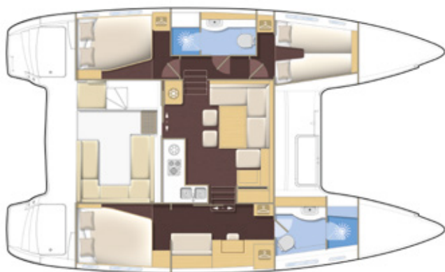
Version propriétaire, 2 salles d'eau Owner's version, 2 bathrooms

Comfort : equipped for long distance cruising, your Lagoon includes all the equipment required for a prolonged and distant cruise.