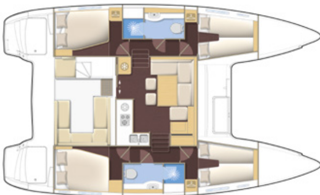
Version 4 cabines, 2 salles d'eau 4 cabin version, 2 bathrooms

Comfort: armato per grandi crociere, il vostro Lagoon è fornito con tutte le dotazioni necessarie per lunghe crociere verso mete lontane.